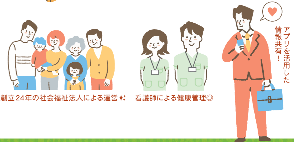
創立24年の社会福祉法人による運営 ✦ 看護師による健康管理 ©

物語という目に見えない世界を自分の心に見えるようにし、子ども達の想像力を豊かにします。小さいときから絵本に親しむ時間を大切にします。