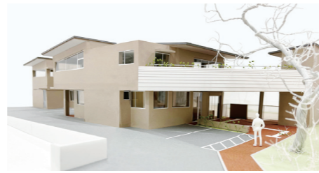
キディ腰越保育園 完成イメージ模型

住所 〒248-0033 神奈川県鎌倉市腰越 5-11-17 (現 腰越保育園 跡地)